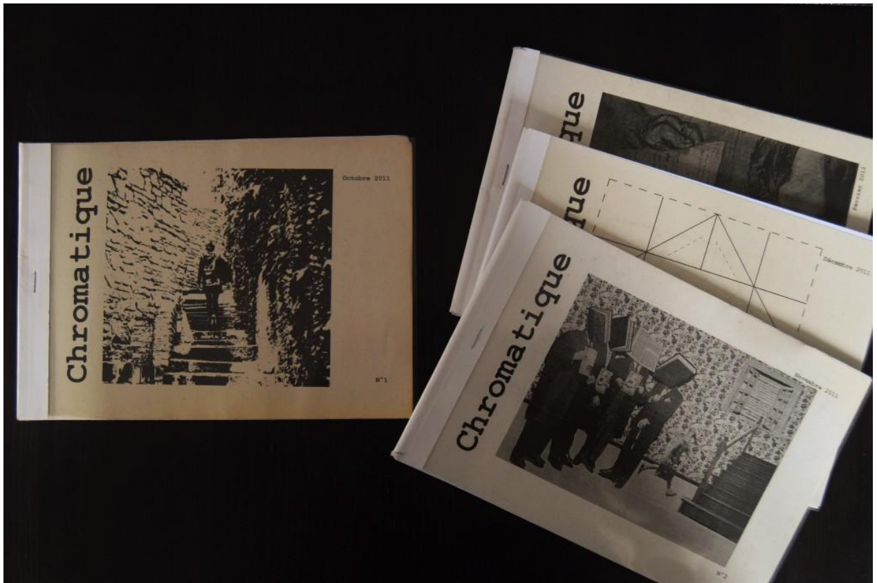
Premiers numéros de Chromatique

plastifiée à un format à la française plus proche du fanzine (n° 8), avant de se muer en un délicat A6 enveloppé de papier calque (n° 11).