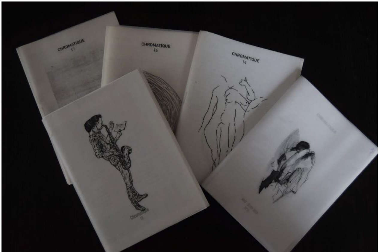
Troisième génération de la revue Chromatique

Lors de chaque publication, les membres assurent eux-mêmes la distribution du numéro, adressant certains exemplaires à leurs amis et à ceux qui ont manifesté leur intérêt à l'égard du projet, en déposant d'autres dans des lieux stratégiques (bibliothèques facultaires, cafés proches de l'université) ou choisis au hasard afin d'aller à la rencontre du lecteur (qui peut être surpris de découvrir une plaquette dans sa boîte aux lettres ou sur le pare-brise de sa voiture). Ses modes de composition et de mise en circulation inscrivent la revue Chromatique dans les productions rassemblées par Jacques Dubois sous l'appellation de « littératures parallèles et sauvages 24 », c'est-à-dire des œuvres brutes, spontanées, artisanales, évoluant en dehors des circuits de production et diffusion du milieu éditorial traditionnel, et, partant, en marge de l'institution littéraire, de ses normes, codes et valeurs. Si les membres du groupe signent la majeure partie des contributions, ils ouvrent également la revue à des oiseaux de passage — amis, proches, condisciples et autres curieux souhaitant faire découvrir leurs textes —, pourvu que les productions soumises au quatuor permettent de faire consensus 25 . Les membres