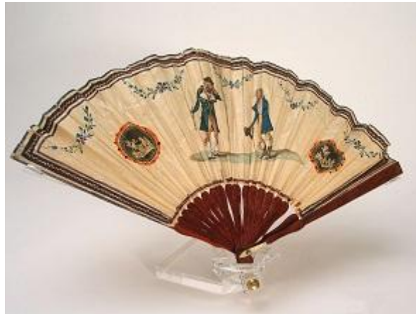
Fig. 8. Les Incroyables, ca. 1797-1798, éventail de papier, Stockholm, Nordiska Museet.

Mais, dans certains cas, la réception de l'œuvre pourrait avoir été encore différente. Ainsi, le Musée nordique de Suède conserve un éventail datant des années 1797-1798 orné des Incroyables de Carle Vernet (fig. 8) 30 . Avec une telle distance, une telle différence de contexte, la question se pose de savoir dans quelle mesure cette image est toujours comique. Il est certain que l'on avait connaissance, en Suède, de la situation politique française, du moins dans ses grandes lignes. Cependant, le sous-titre « les Incroyables », qui aurait permis d'associer cette image à la France, n'est plus là. Sortie de son contexte et ornant un éventail de belle qualité aux côtés de guirlandes et de médaillons représentant des putti , il est peu vraisemblable que l'œuvre de Vernet ait fait toujours rire. Il semble qu'elle ait été plutôt choisie pour sa représentation d'un certain goût vestimentaire, faisant ainsi écho à l'objet de coquetterie qu'elle décore.