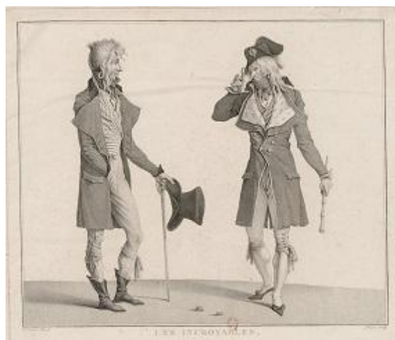
Fig. 1. Carle Vernet, Les Incroyables , gravure par Louis Darcis, 1796. Paris, Bibliothèque nationale de France.

prédisposant ainsi le public au rire tout en lui évitant l'effort intellectuel de le déceler par lui-même 4 .