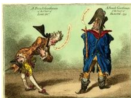
Fig. 6. James Gillray, A French Gentleman of the Court of Louis XVI th / A French Gentleman of the Court of Egalité , 1799. Londres, British Museum © The Trustees of the British Museum.

en français. Le fait qu'une telle œuvre apparaisse en Angleterre à ce moment-là montre qu'une autre image des Français est en train de se créer entre 1795 et 1800 ; les sans-culottes assoiffés de sang, bien que toujours présents, ne sont plus l'unique vision des Français reflétée par la caricature. Le personnage prétentieux et efféminé de l'Incroyable ouvre sur un nouvel argumentaire, lequel porte sur une perte des anciennes valeurs et de la morale 28 . On peut ainsi mettre en relation ces idées avec une caricature de Gillray de 1799 montrant deux gentilshommes français, l'un de l'époque de Louis XVI et l'autre de la fin du Directoire : le premier déclare « je suis votre très humble serviteur » en faisant la révérence, tandis que le second, vêtu en Incroyable, écarte les pans de son manteau pour montrer son postérieur en lui répondant : « baisez mon cul » (fig. 6).