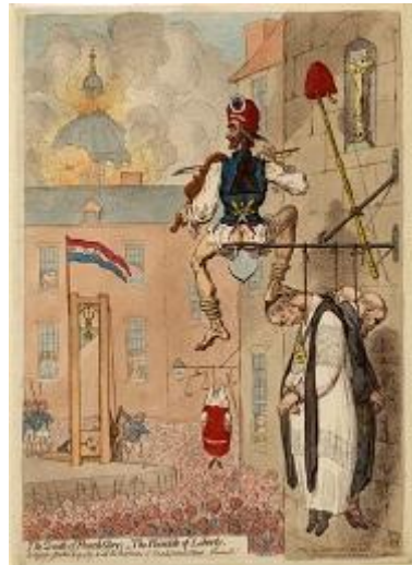
Fig. 5. James Gillray, The zenith of French glory ; the pinnacle of liberty , gravure par Hannah Humphrey, 1793. Londres, British Museum

Depuis 1789, les caricatures anglaises visant les Français s'attaquaient davantage aux sans-culottes qu'à leurs opposants. Craignant que la Révolution française ne donne des idées à leurs compatriotes, les artistes britanniques représentaient les Jacobins comme des extrémistes assoiffés de sang, parfois même cannibales, et très maigres en raison de la pauvreté et des famines engendrées par la Révolution. Gillray, par exemple, a dessiné le peuple français assistant à l'exécution de Louis XVI (que l'on reconnaît grâce à la couronne peinte sur la lame de la guillotine), un sans-culotte jouant joyeusement du violon au premier plan, tandis que des ecclésiastiques et des aristocrates sont pendus aux lanternes (fig. 5). La guillotine tend à l'omniprésence dans ces caricatures britanniques et la période de la Terreur a fourni aux Anglais de solides arguments contre les idées Jacobines 27 . Plusieurs années après la chute de Robespierre, les images sanglantes sont toujours d'actualité et leur effet renforcé par la crainte d'une invasion de la Grande-Bretagne par la France.