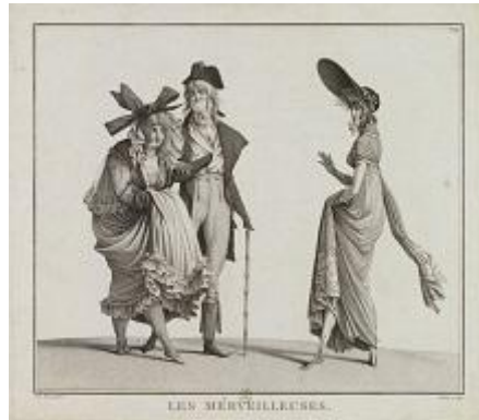
Fig. 2. Carle Vernet, Les Merveilleuses , gravure par Louis Darcis, 1796. Paris, Bibliothèque nationale de France.

nécessaire de comprendre le contexte de production de cette estampe pour en expliquer la popularité et la réception contemporaine. Par ailleurs, cette oeuvre présente un cas particulier, puisqu'elle a été publiée au même moment dans d'autres pays que la France. Nous nous intéresserons donc dans un second temps à la réception multiple de cette gravure, et étudierons en particulier la manière dont elle a pu être accueillie en Angleterre. La Grande-Bretagne était en guerre contre la France lorsque l'estampe de Carle Vernet y circulait, et il s'agira de comprendre comment cette oeuvre a pu s'inscrire dans ce contexte de tensions politiques.