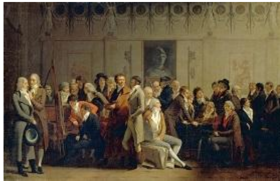
Fig. 3. Louis-Léopold Boilly, Réunion d'artistes dans l'atelier d'Isabey , 1798, Paris, Musée du Louvre.

De telles prises de position montrent que les tensions entre Jacobins et anti-révolutionnaires étaient loin d'être apaisées au début du Directoire et que l'on avait à l'esprit les éventuelles conséquences d'une telle image.