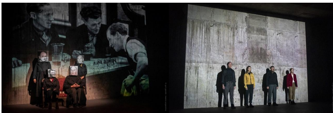
"Un extranjero" de Beatriz Catani, Centro de Experimentación y Creación del Teatro Argentino, La Plata, 2024.

(30 minutos seguidos de un debate de 10 minutos) (30 minutos seguidos de un debate de 10 minutos) (30 mn suivi d'un échange de 10 mn) (30 minutes followed by a 10-minute discussion)