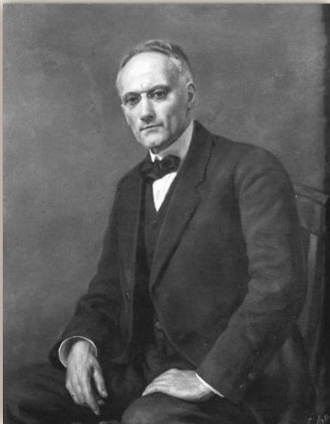
Portrait de Charles Bally (1865-1947), professeur à l'Université de Genève