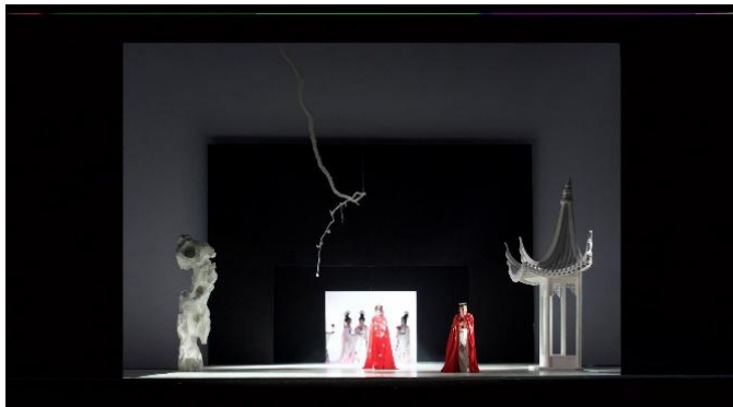
The New Genius Experience of The Great Atomic Bombreflector. ORTA cie, Almaty. Photo Nurtas Sissekenov 2025