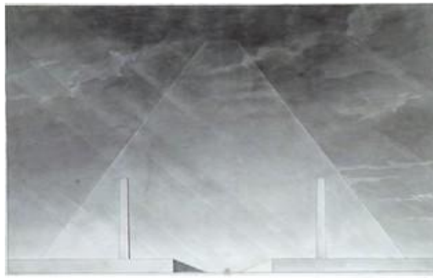
Étienne-Louis Boullée, Cénotaphe en forme de pyramide tronquée, dessin .

L'énergie de langage est en proportion inverse de la quantité de discours, on est en droit de supposer que le discours qui se réduirait à un mot, à un geste ou même au silence total, serait, de tous les modes le plus énergique 33 .