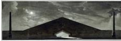
Étienne-Louis Boullée, entrée pour un cimetière.

nous semble que Boullée, reprenant à son compte cette hypothèse 61 , établit un lien entre cette conception nouvelle de l'architecture et avec ce que Diderot dit de la poésie qui « veut quelque chose d'énorme, de sauvage de barbare. » La règle du poète est de « se jeter dans les extrêmes 62 . » Cette énergie et cette force de transgression, ce brouillage des catégories et ce mélange des genres présents également chez Ledoux contribuent à l'élaboration du sublime situé au cœur de la poésie romantique 63 .