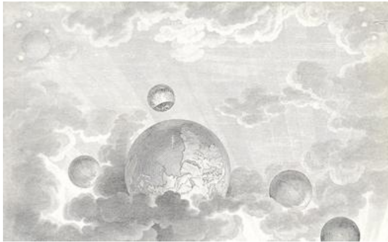
Planche n° 100 de L'Architecture considérée sous le rapport de l'art des mœurs et de la législation . Élévation du cimetière de la ville de Chaux.

Les trois projets dessinés (plan, coupe et élévation 49 ) proposent trois visions de ce séjour des morts : le plan reproduit le tracé circulaire et rayonnant de la cité des vivants alors que l'élévation, représentant le système solaire, invite le lecteur à méditer sur la naissance du monde. Pour Boullée, c'est l'architecture funéraire qui « demande plus particulièrement que toute autre la poésie de l'architecture 50 . » Cette innovation soulignera la hardiesse de la conception qui met en évidence la structure de l'édifice et l'utilise en tant que facteur esthétique :