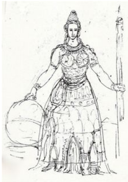
Figure II - J. Machereau, Le temple femme, dessin BA Ms 13910. D'après Antoine Picon, Les Saint-simoniens, raison, imaginaire et utopie , Paris, Belin, 2002.