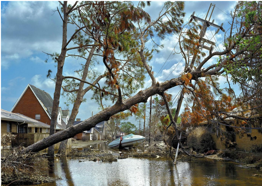
Figure 1 : Robert Polidori, image extraite d' After the flood . Avec l'aimable autorisation de l'artiste.

Le renvoi des images à tout un « musée imaginaire 11 » des représentations de la catastrophe tend à amplifier la suggestivité des vues (on pense notamment ici aux figurations du Déluge). Le chaos donné à voir correspond à l'état dramatique de la ville dans les mois qui suivirent le passage de l'ouragan, mais il suggère aussi, par métonymie, l'intensité d'un phénomène excédant les capacités de résistance de l'homme et de ses constructions. L'évocation de la puissance destructrice des éléments passe tout à la fois par une dimension « symbolique » (en lien avec des normes et des habitudes de figuration), « iconique » (grâce à la suggestivité formelle des images) et « indicielle » (dans une relation de causalité avec les phénomènes enregistrés 12 ) — ces différents fonctionnements se combinant et se confortant mutuellement pour assurer à la série un impact optimal. Les vues de Polidori satisfont de la sorte à l'esthétique du sublime, telle qu'elle se trouve définie dans une veine sensualiste par Edmund Burke 13 , puisque la perception des images travaille à déclencher un sentiment proche de la terreur.